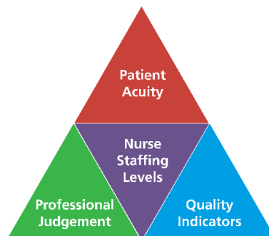
Ffigur 1 – Ymagwedd drionglog tuag at gyfrifo lefelau staff nyrsio ar wardiau meddygol a llawfeddygol.

Mae'n ofynnol ar y person neilltuol ddefnyddio tystiolaeth, gan ddefnyddio ymagwedd drionglog , i bennu'r lefel staff nyrsio .